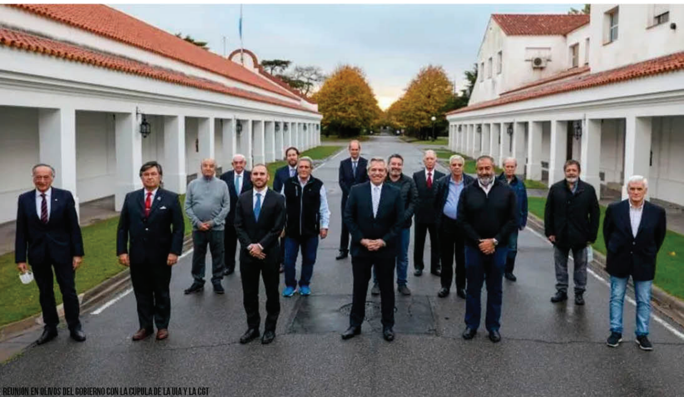
REUNIÓN EN OLIVOS DEL GOBIERNO CON LA CÚPULA DE LA UIA Y LA CGT